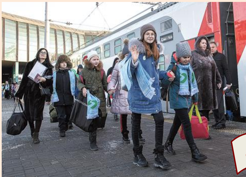
Мустафаева Л. Игра от первоклассников // Гудок. – 2020. – 16 января.

На каждом игровом этапе нужно прочитать стихотворение, отгадать последнее слово рифмы и получить право бросить кубик, а если ещё и повезёт, то сделать фишкой шаг, стать ближе к финишу.